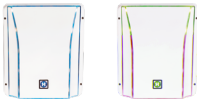
BLEU Génération de chlore

Tous les paramètres sont contrôlés par une application gratuite dédiée Salt&Swim+ (connexion Bluetooth).