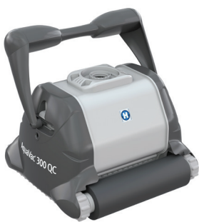
AquaVac 300 QC versión cepillo de espuma