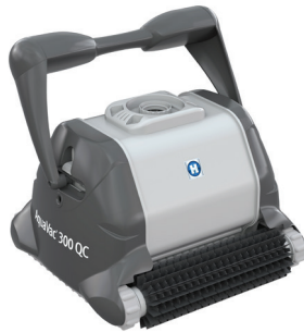
AquaVac 300 QC versión cepillo de plástico