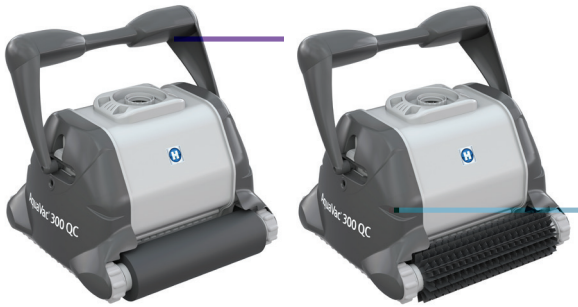
AquaVac 300 QC version mousse