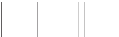
Vanne Vari-Flo™ 6 positions