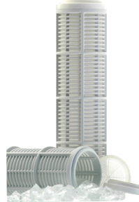
Polyphosphate et Filtration anti-